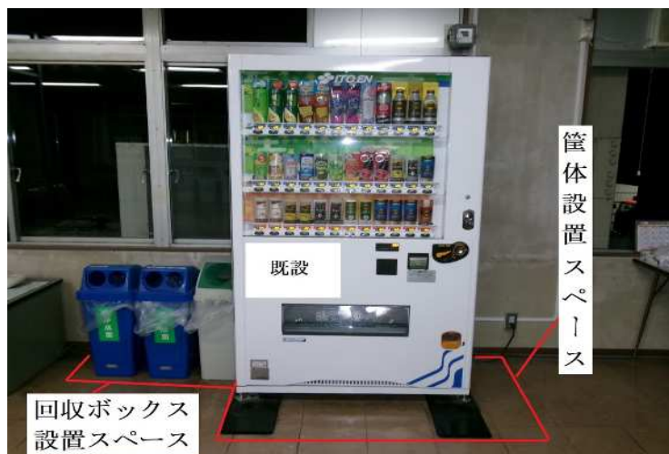
筐体及び回収ボックス設置場所