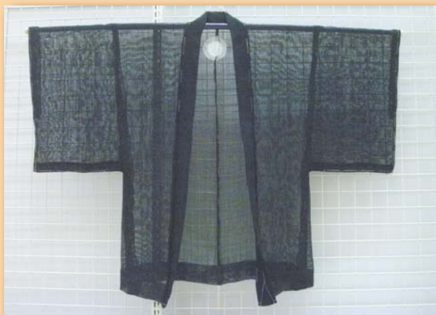
復元された津綆子の黒羽織(安濃郷土資料館)

しかし、江戸時代の末ごろには藩の御用が減少し始め、明治時代になると、綿織物・綿糸を中心とした近代化された繊維産業に押されて、津綆子の生産は衰退の一途をたどります。それでも、昭和初期までは、津綆子を扱う業者がわずかに残っていたようですが、その後、生産が途絶えてしまいました。