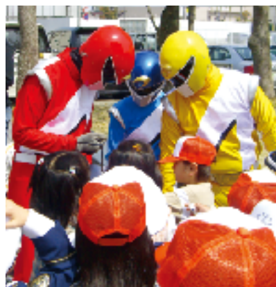
イベント会場で子どもたちに囲まされると、疲れも吹き飛ばす。

一方で、一緒に活動してくれる才能ある若者の発掘にも力を注いでいます。趣味・特技で培ったものを、ショーでの衣装製作や台本の作成などで発揮すれば、それが人を楽しませ、地域の活性化につなげることができることをぜひとも知ってもらいたいと目を輝かせます。