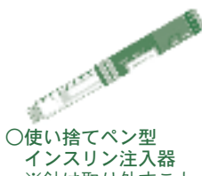
○使い捨てペン型インスリン注入器 ※針は取り外すこと