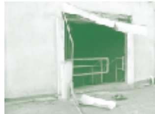
爆発事故でシャッターが壊れた施設