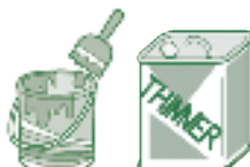
ペンキ・シンナー