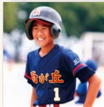
西が丘スポーツ少年団でソ フトボールをしていたころ

市長 西が丘スポーツ少年団、 実は後輩たちも頑張っていて、 去年は中日本大会に出場した そうです。