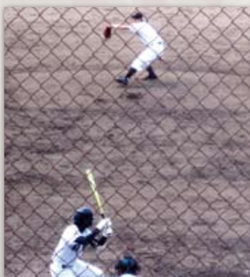
津東高校で実力を身に付け、 同校初のプロ野球選手に