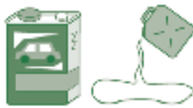
オイル・灯油など