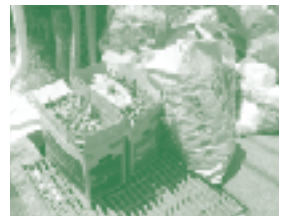
ダンボール箱、紙袋に入れて出されたごみ

家庭ごみ(燃やせるごみ・びんなど)を出す場合は、ダンボール箱や紙袋には入れず、中身の見える透明または半透明の袋に入れて集積所に出してください。ダンボール箱と紙袋は、 必ず資源として下記のとおり 出してください。