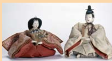
細面な顔立ちの内裏びな