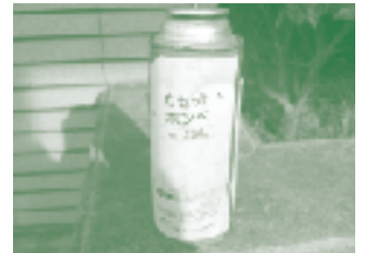
事故現場から見つかった穴の開いていないカセットボンベ