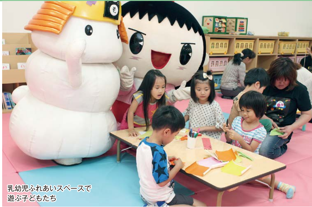
乳幼児ふれあいスペースで遊ぶ子どもたち