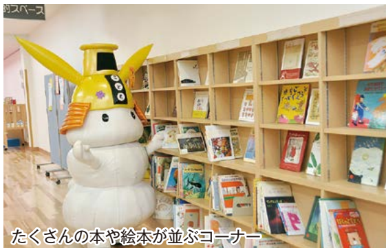
たくさんの本や絵本が並ぶコーナー

先月の7月1日に、津センターパレスの地下1階にオープンした「津市まん中こども館」のことだね。「丸之内児童館」っていうのが、これまで津市社会福祉センターにあったんだけど、建物が老朽化してきたので、ここを閉館して、新しくこども館を作ったんだよ。