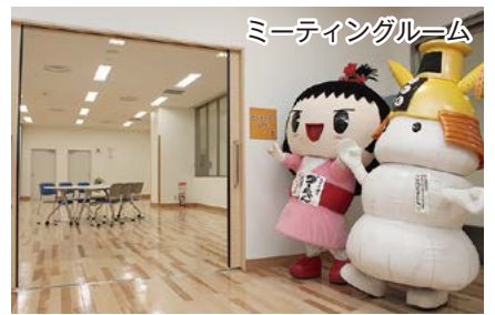
ミーティングルーム

子どもたちが遊びを通して、友だちをつくったり、いろんな体験をしたりする場所なんだ。大きく分けて3つのスペースがあるんだよ。