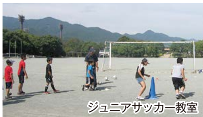
ジュニアサッカー教室

対象 市内に在住・在勤・在学の人 申し込み スポーツ振興課、津市体育館、津市民プール、各総合支所地域振興課、津市スポーツ協会にある所定の用紙に必要事項を記入し、直接またはファクスで提出 締め切り 8月14日(水)