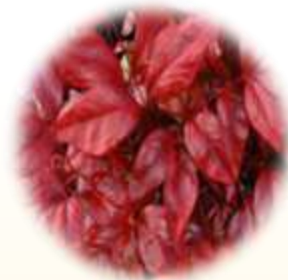
オタフクナンテン