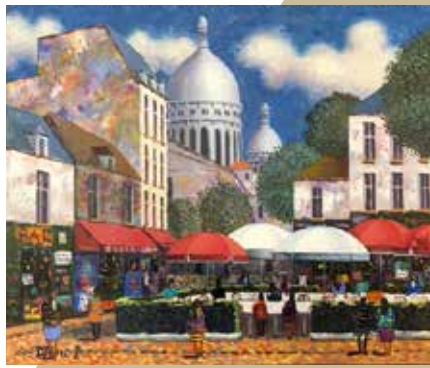
モンマルトルのカフェ