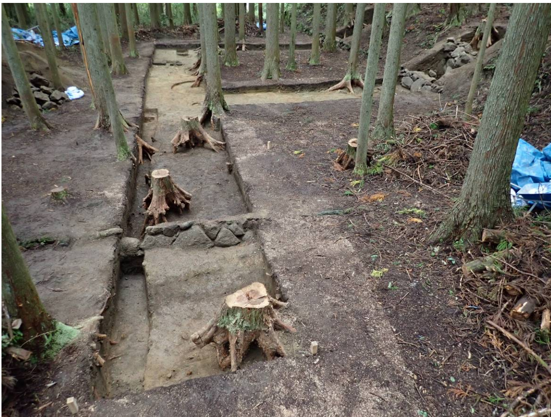
調査区全景 東から