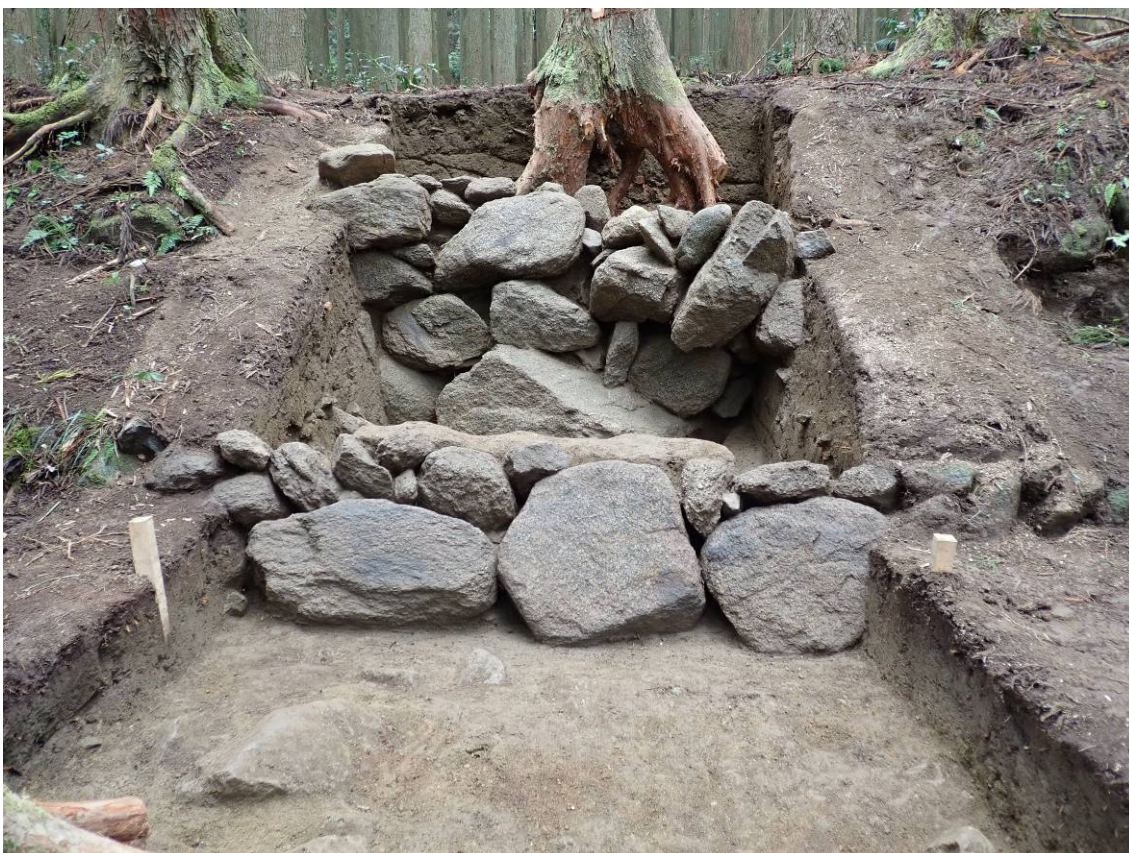
石積 1 (奥)、石積 2 (手前) (トレンチ 2) 南から