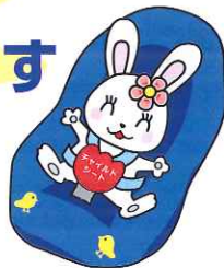
チャイルドシート着用推進シンボルマーク「カチャビヨン」