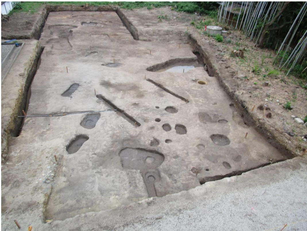
調査区全景(西から)