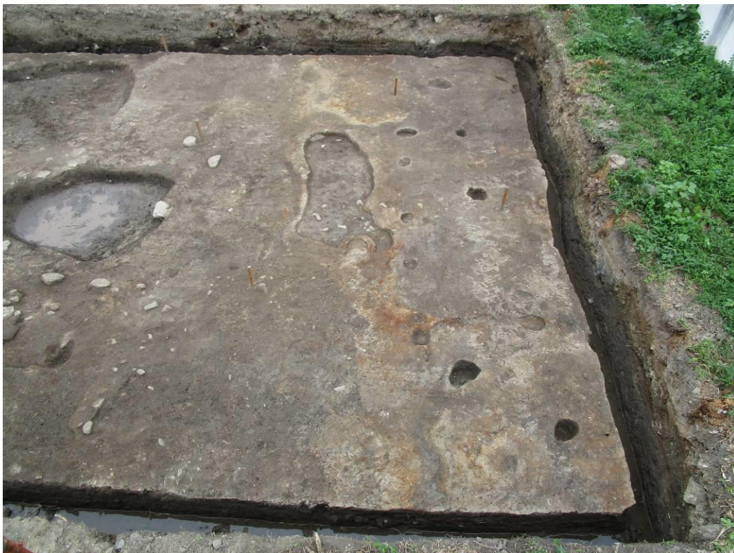
調査区東部(南から)