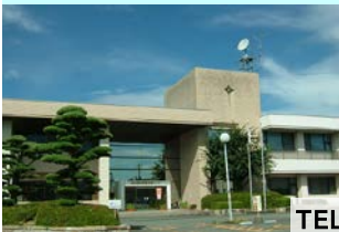
一志農村環境改善センター