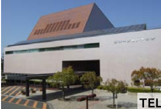
津リージョンプラザ