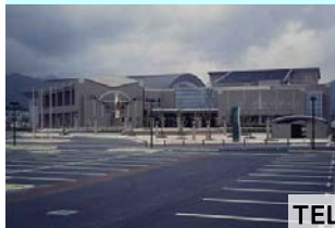
芸濃総合文化センター