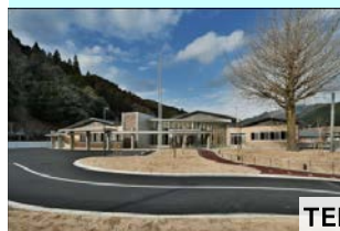
美杉総合文化センター