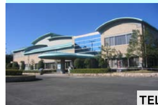
美里文化センター