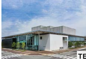
久居アルスプラザ