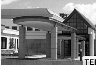
サンデルタ香良洲