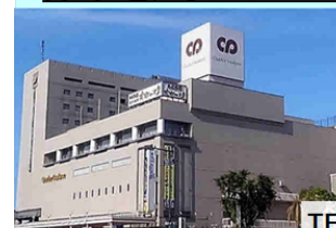
津市センターパレスホール