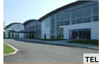
白山総合文化センター