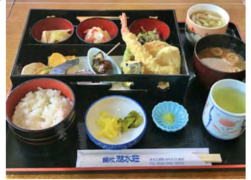
時季によって食材が変わります