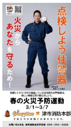
住宅用火災警報器普及啓発用ポスター