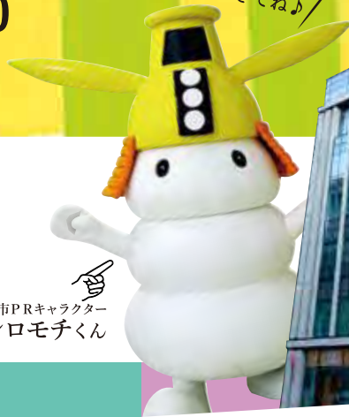
津市PRキャラクター シロモチくん