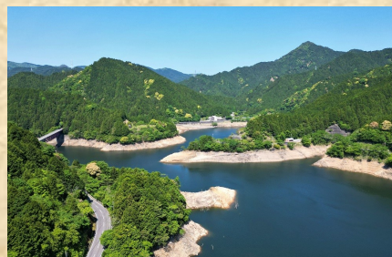
錫杖湖と錫杖ヶ岳(ドローンから撮影)