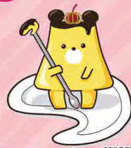
津市物産振興会スイーツ部会 公式キャラクター 「ふりんっ君」