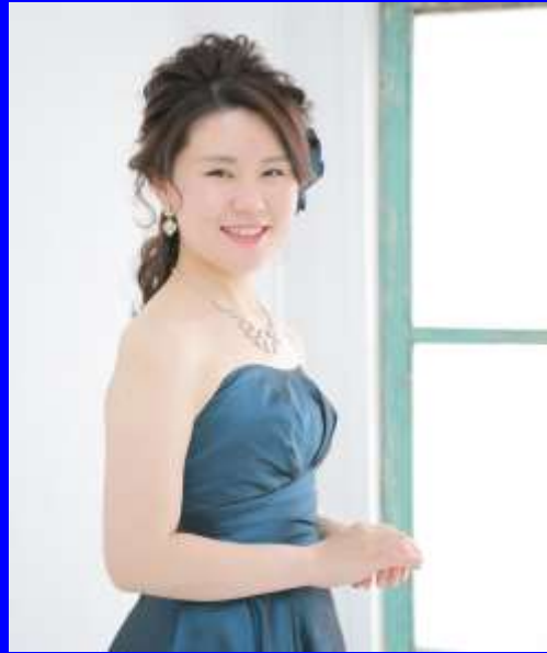
兼重 優子氏 (ピアニスト)