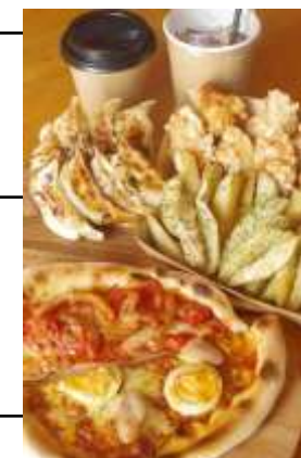
オープン記念セット イメージ