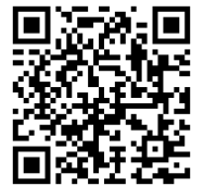
接種協力医療機関一覧