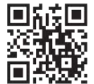
コロナワクチンナビ